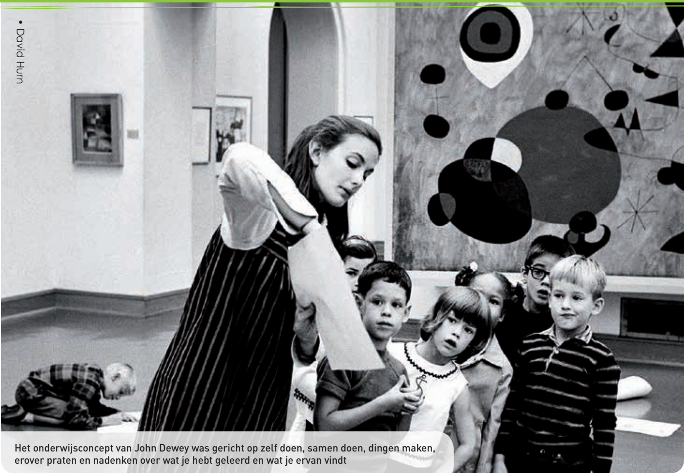
Het onderwijsconcept van John Dewey was gericht op zelf doen, samen doen, dingen maken, erover praten en nadenken over wat je hebt geleerd en wat je ervan vindt