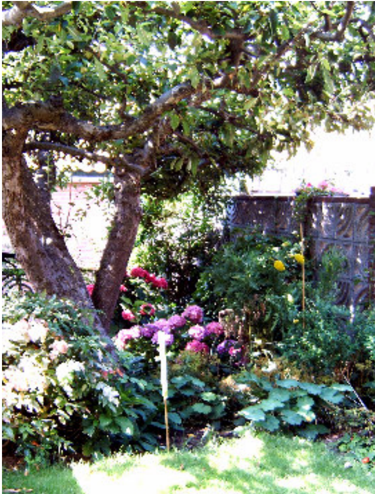
Daar ergens moet ze gestaan hebbeh

De achteruitgang van mijn achterbuurman is tegenover de mijne. Hoewel hij daarvan nauwelijks gebruik maakt en door de hoge muren waarmee zijn domein omgeven is geen gezicht heeft op mijn achtertuin bedacht ik dat hij meer zou kunnen weten. Ook hij is immers bij de politie, in een grote stad niet ver van hier. Tegenwoordig houdt hij zich voornamelijk met denkwerk bezig, begreep ik.