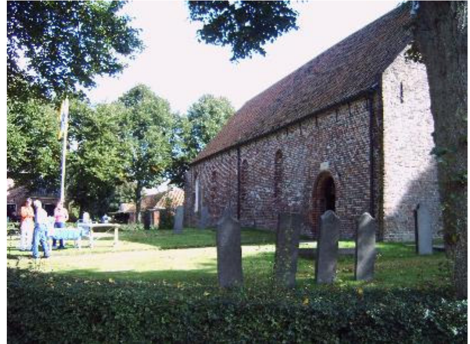
Mijn bestemming bereikt. De deur stond open

Ik had natuurlijk al lang begrepen dat er een fout was begaan bij het invoeren van het adres maar had alle tijd. Het eerste uur van de middag was nog niet voorbij. De kerkdeur stond open en op het toegangspad was een kraampje opgericht. Drukwerk lag uitgestald en twee jongens zaten er bij in afwachting van wat komen ging. Het was museum opendag! Toegang gratis. Niets weerhield me om naar binnen te gaan. Ik maakte foto's en een praatje met de jongens. Kocht wat informatiemateriaal en vulde het bezoekersformulier in en de kolom "Hoe kwam u tot dit bezoek?" met: Toeval!